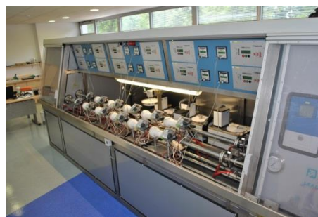
Slika 4: Preskusno postrojenje Enerkal

Za kompaktne izvedbe merilnikov se uporablja preskusno postrojenje Enerkal.