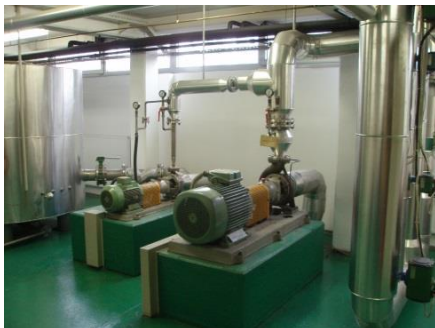
Slika 1: Tehnološki del postrojenja Volukal

Za merilnike pretoka razstavljivih konstrukcij uporabljamo preskusno postrojenje Volukal, v katerem se stalno vzdržuje ca. 7 m 3 na temperaturi 50°C. Na tem postrojenju lahko opravljamo kontrole merilnikov dimenzij od DN 15 do DN 150 mm.