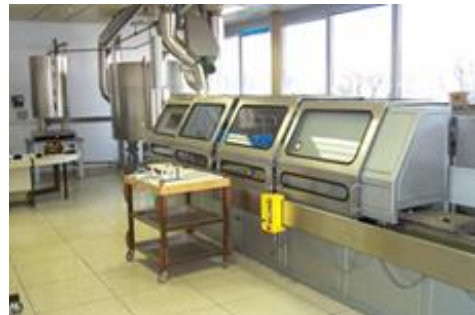
Slika 2: Preskusni pult - Volukal

Računske enote kontroliramo na napravi Kompukal, kamor se priključi računska enota. Pri kontroli se iz naprave generira temperaturna razlika dovoda in povratka ter pretok, kot v realnih pogojih delovanja. Preko izhodnega signala iz računske enote sprejemamo izmerjeno vrednost toplotne energije v času kontrole za vsako posamezno meritev.