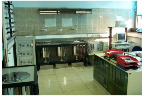
Slika 3: Preskusna naprava Termokal in Kompukal

Za kompaktne izvedbe merilnikov se uporablja preskusno postrojenje Enerkal.